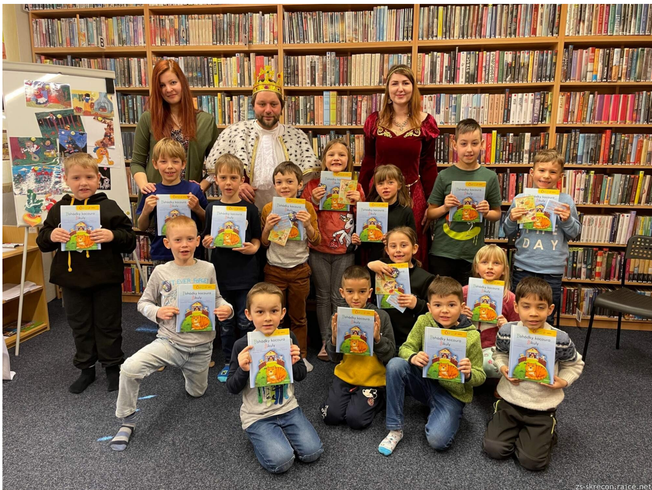
Pasování na čtenáře