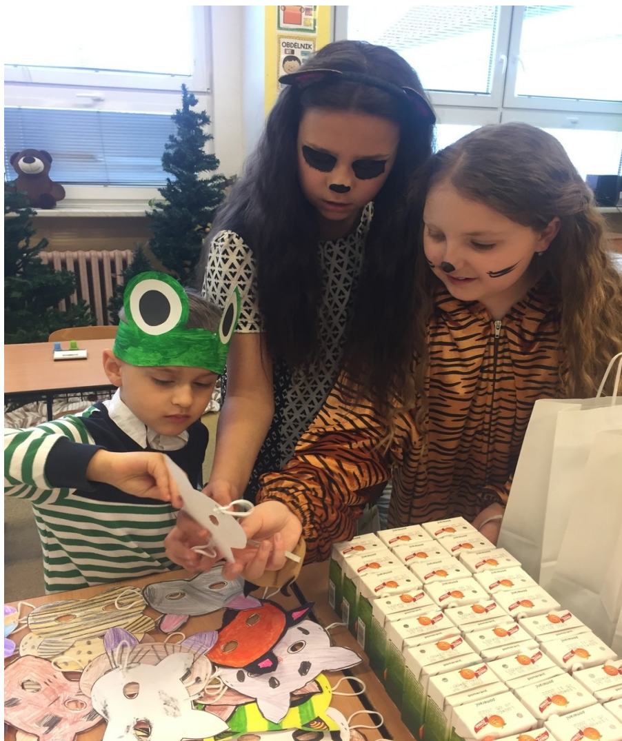
Zápis do I.třídy