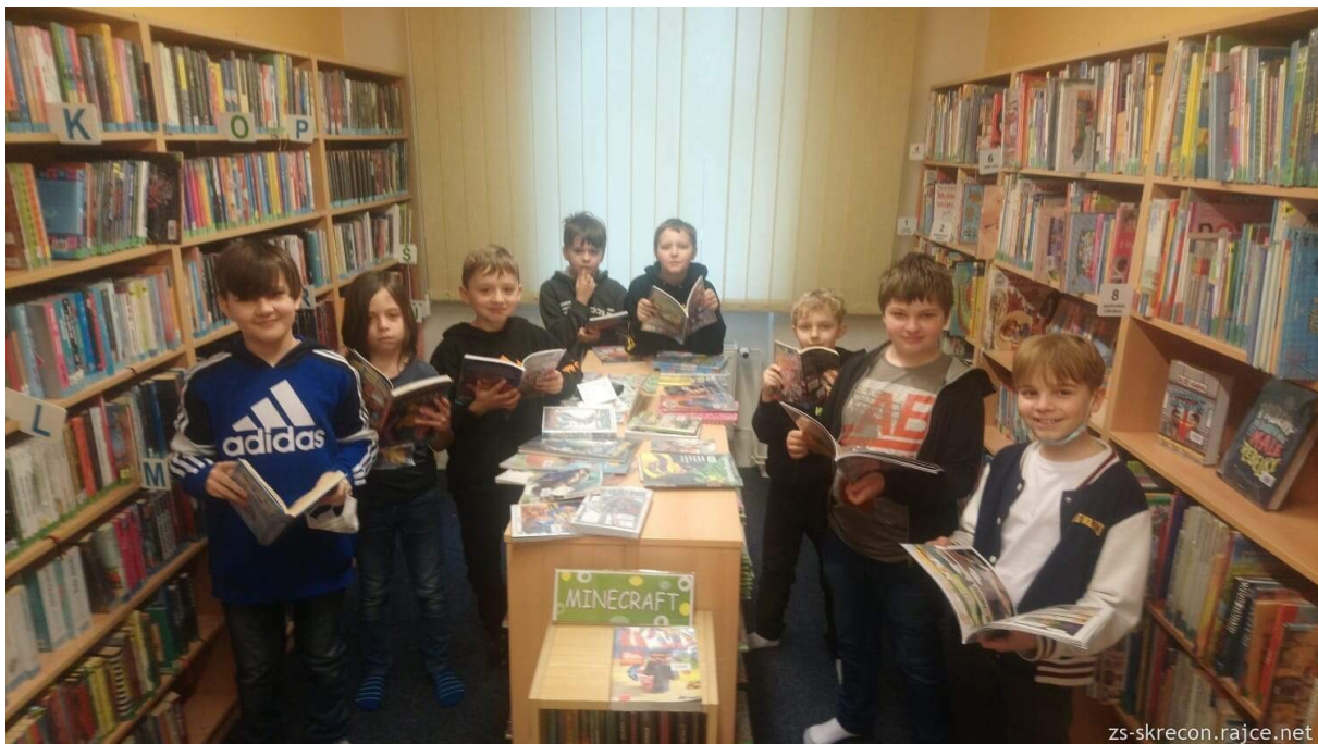
Čtvrťáci v knihovně