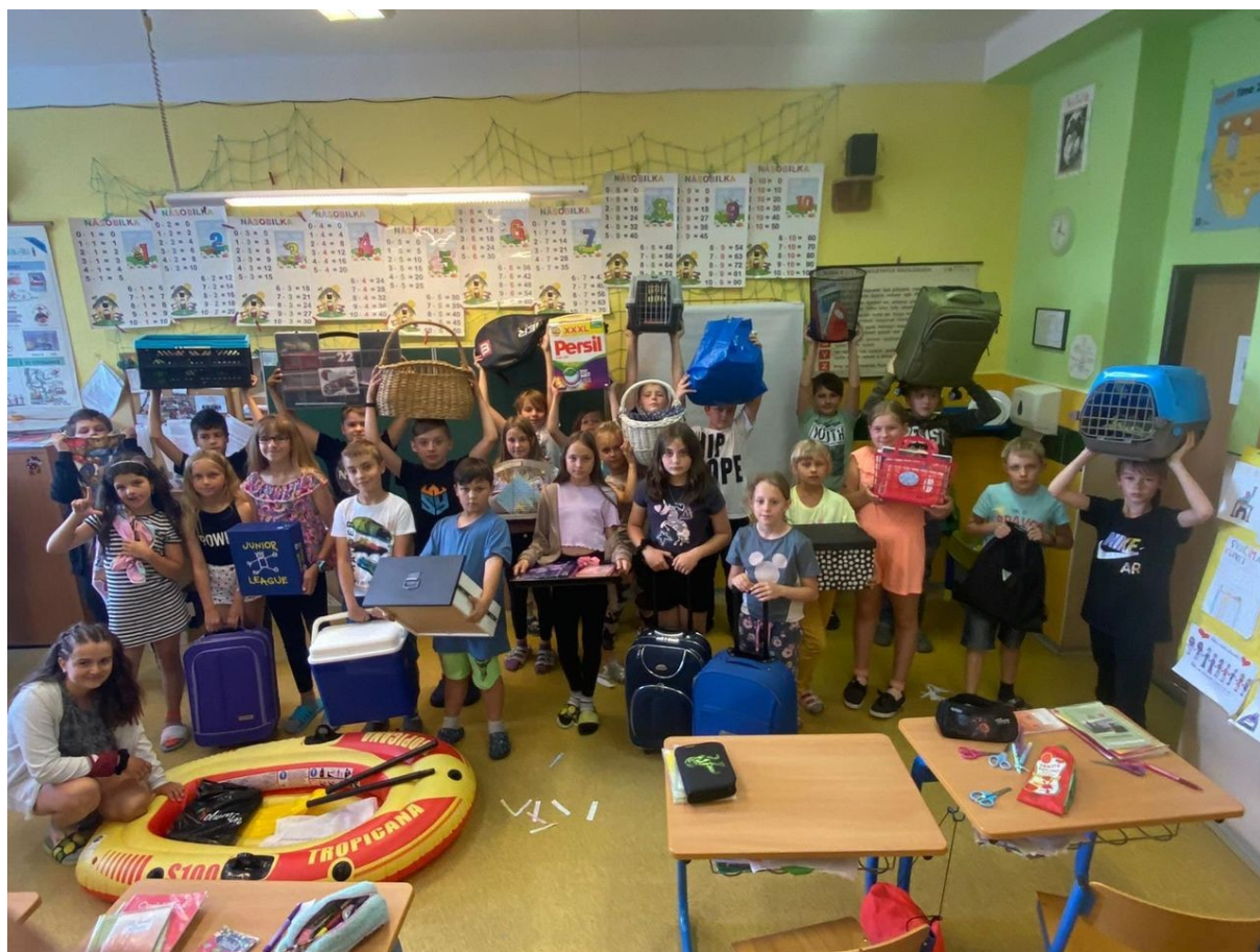
No Backpack Day

Také 34 dětí mateřské školy pobývalo týden ve škole v přírodě v Budišově nad Budišovkou.