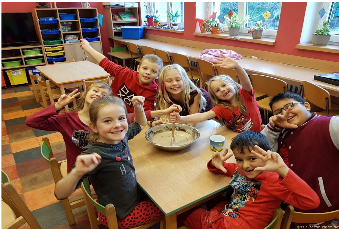
Činnost ŠD - pečení

V letošním školním roce prázdninový provoz ŠD neprobíhal. Ze strany rodičů byl velmi malý zájem a činnost školní družiny o prázdninách nebyla zahájena.