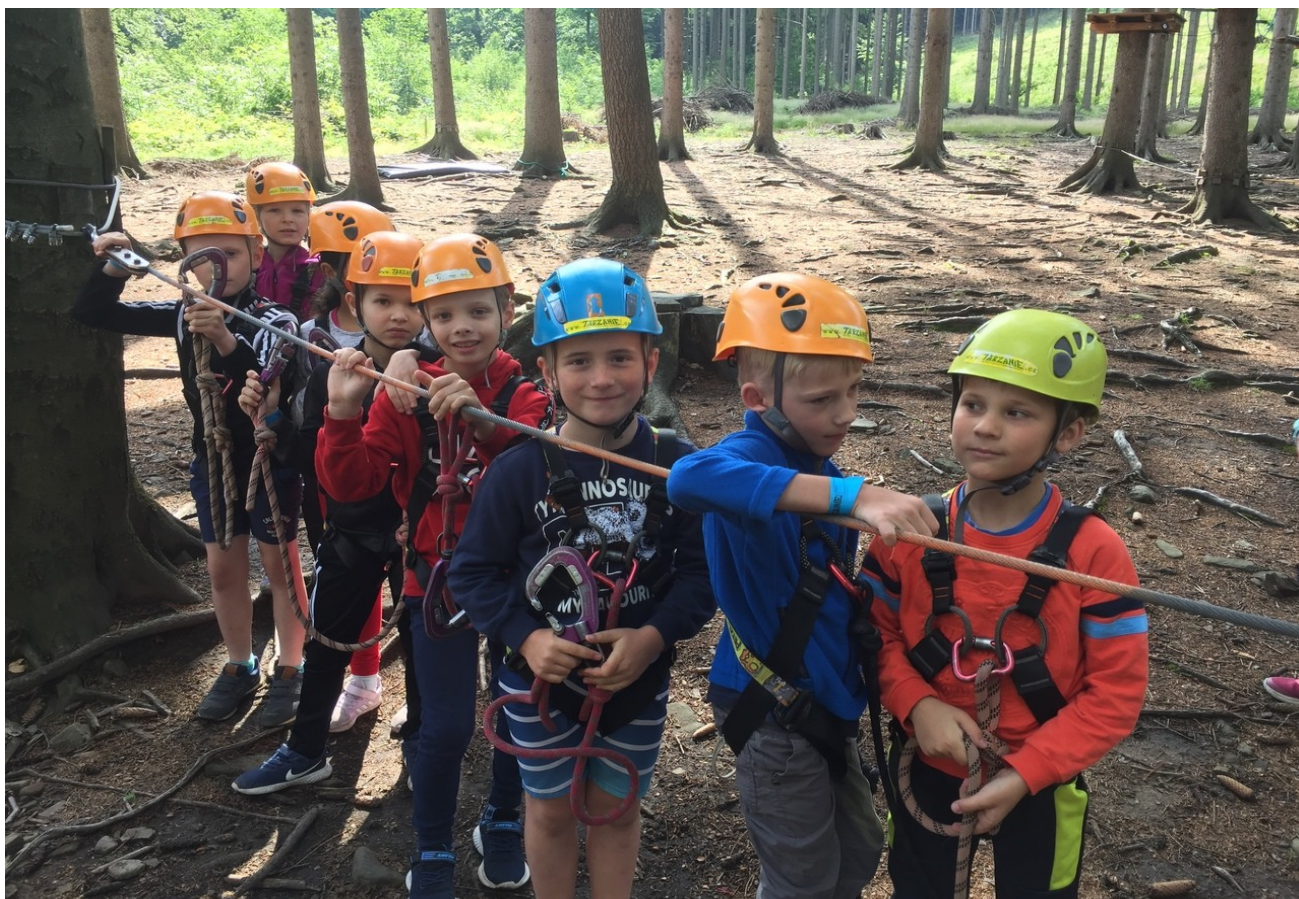
Na výletě - Trojanovice