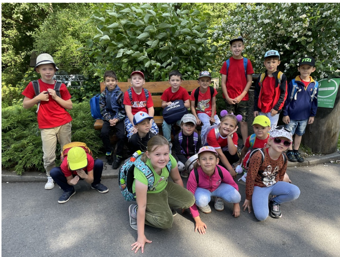
Na výletě – ZOO Ostrava