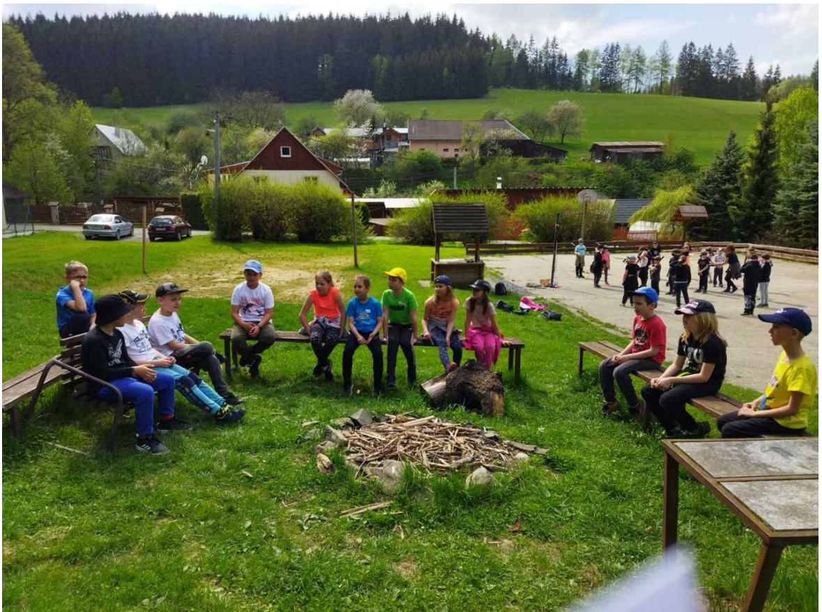
Škola v přírodě