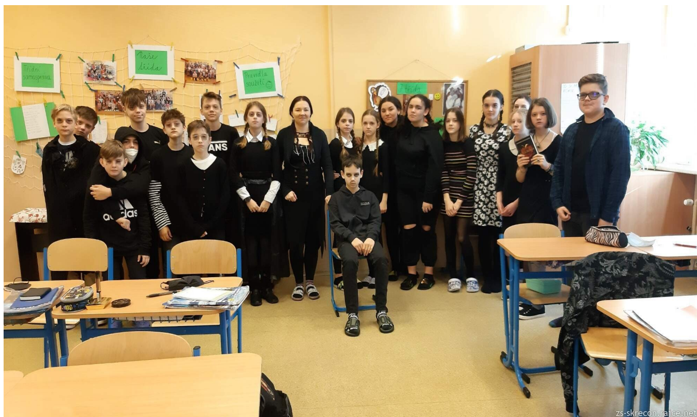
Den seriálových postav